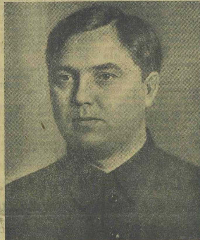
Герой Социалистического Труда Г. М. Маленков